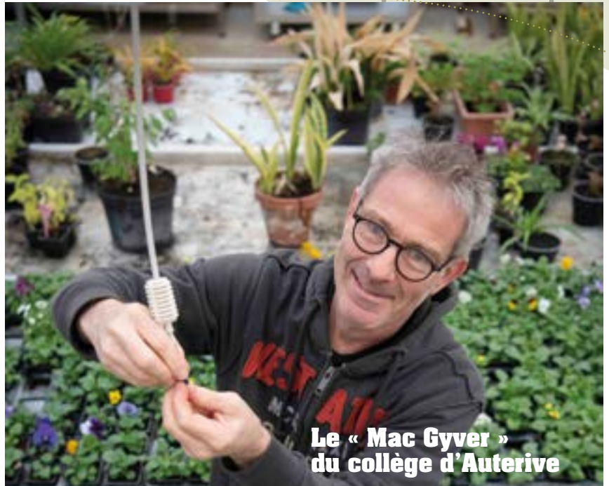
Le « Mac Gyver » du collège d'Auterive

J'ai la chance de travailler dans un établissement où l'on me sollicite parfois pour fabriquer des choses en lien avec les projets pédagogiques, et j'adore ça. Par exemple, il arrive que des élèves de la section SEGPA viennent m'aider à l'atelier pendant de courts stages professionnels d'une semaine.